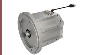
Yeni GVM310 PMAC Motoru