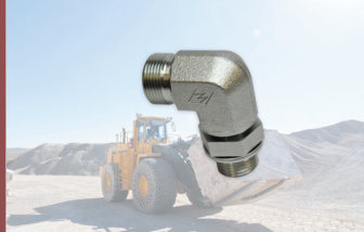
Yeni Ayarlanabilir Dirsek Rakoru